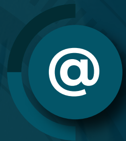
Enlaces de interés