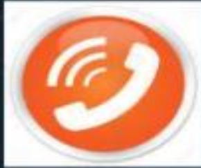
Líneas de Atención Línea Oro