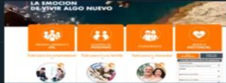
Página Web https://www.positivaenlinea.gov.co