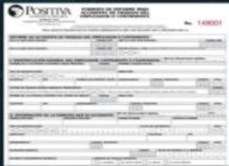
Formato físico en cada punto de atención de cada ciudad