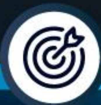
Tabla de contenidos

Introducción y fundamentos de la creatividad