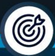
Tabla de contenidos

Qué son los Ecosistemas y su función principal importancia en el desarrollo de las comunidades.