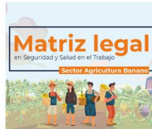
Sector agricultura (banano)