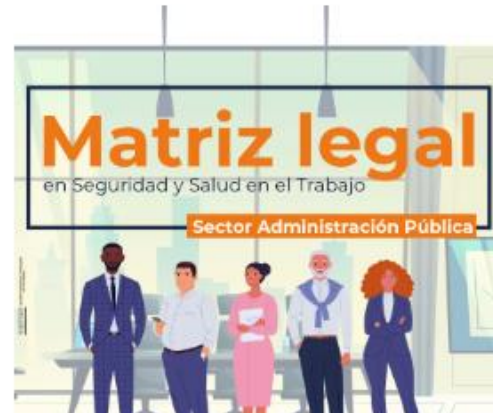
Sector administración pública