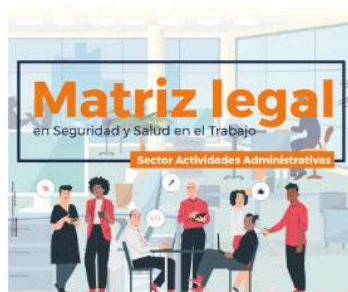
Sector actividades administrativas