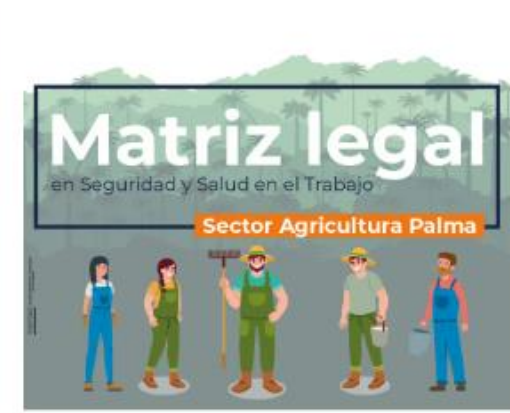
Sector agricultura (palma)

https://posipedia.com.co/n-matriz-legal/