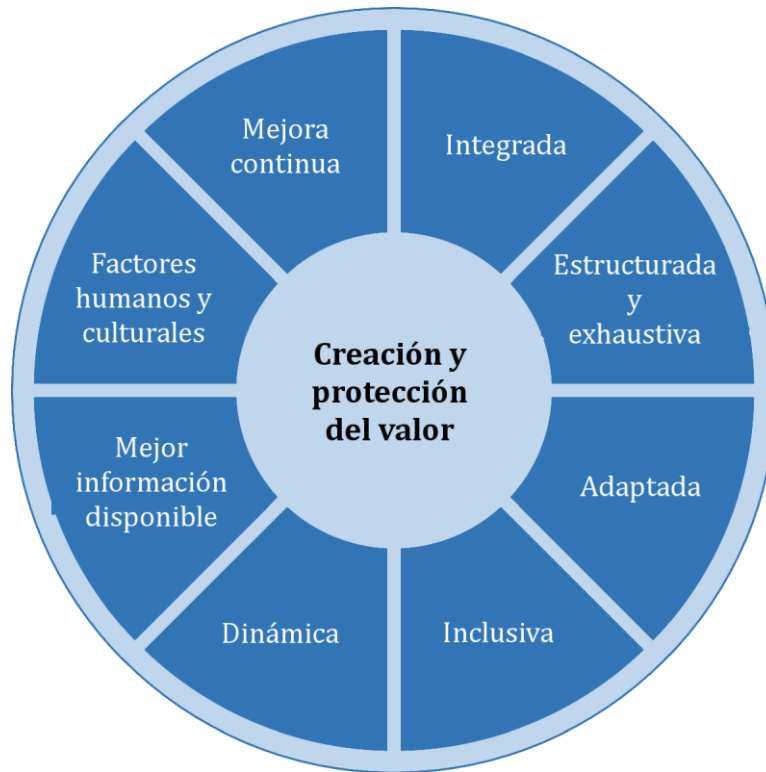
Figura 2 - Principios

La gestión del riesgo eficaz requiere los elementos de la figura 2 y puede explicarse como sigue.