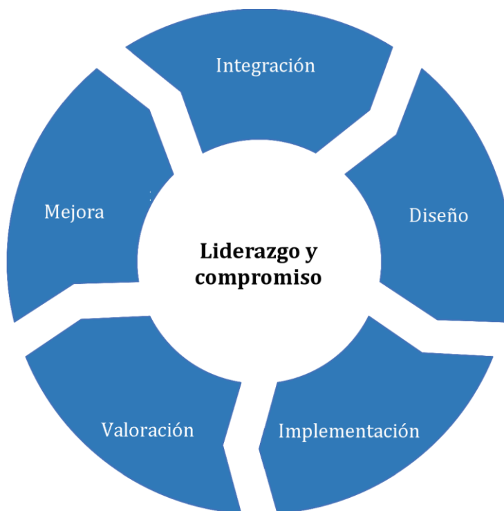
Figura 3 – Marco de referencia

La organización debería valorar sus prácticas y procesos existentes de la gestión del riesgo, valorar cualquier brecha y abordar estas brechas en el marco de referencia.