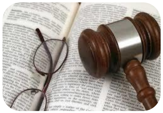
ENTRA EN VIGENCIA 26/08/2022