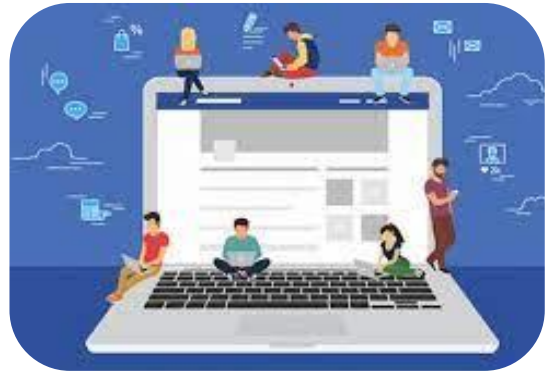
PUBLICADA DIARIO OFICIAL 08/02/2022