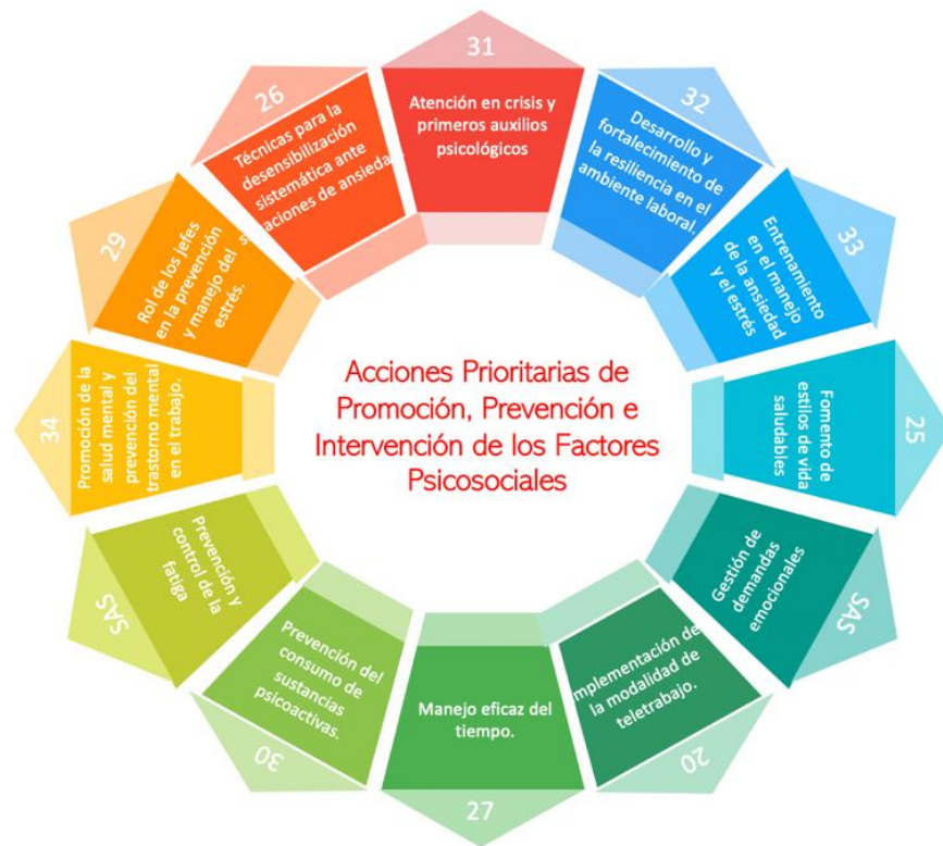
Ilustración 5. Acciones prioritarias de P y P e intervención de los factores psicosociales.

De igual manera se han definido las actividades de intervención hacia las personas (Figura 6). Que nos permitirán el fortalecimiento de las competencias del individuo priorizando en las que se resaltan en el siguiente cuadro.