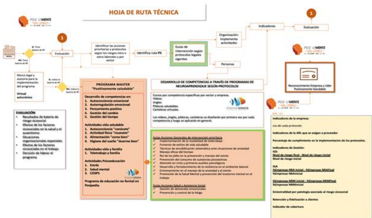
Ilustración 2. Ruta técnica de actuación Positivamente Saludable

Con el fin de que se pueda conocer y materializar en su magnitud el programa diseñado de competencias del SER, a continuación, mencionamos los entregables que harán parte de este programa para que se puedan realizar las acciones de formación y entrenamiento en las empresas.