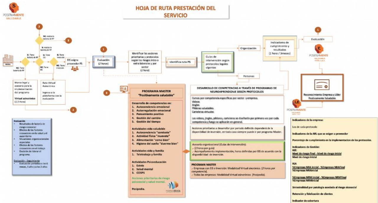
Ilustración 7. Ruta prestación del servicio, Positivamente Saludable

El esquema que se presenta en la ilustración 7, da alternativas a los aliados estratégicos para que se defina bien sea con entornos presenciales o virtuales la implementación el modelo Positivamente Saludable y así cumplir con la gestión de los riesgos psicosociales en el ámbito laboral y por consiguiente con los requerimientos que exige la ley.