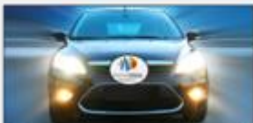
Generan mayor visibilidad al conductor de su entorno especialmente en oscuridad y/o condiciones climáticas específicas