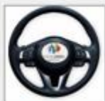
Dar la dirección al vehículo