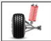
Brindar estabilidad al vehículo, mantener en contacto la llanta con la superficie, absorbe las irregularidades del terreno