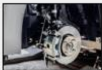
Detener la marcha del vehículo