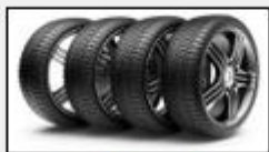
Adherir el vehículo a la superficie – soportar el peso