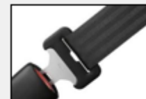
Minimizas heridas, colisiones entre ocupantes, evitar ser arrojados fuera del vehículo