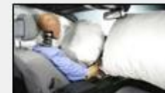
Amortigua, absorbe la energía del impacto entre la consola del vehículo y el ocupante.