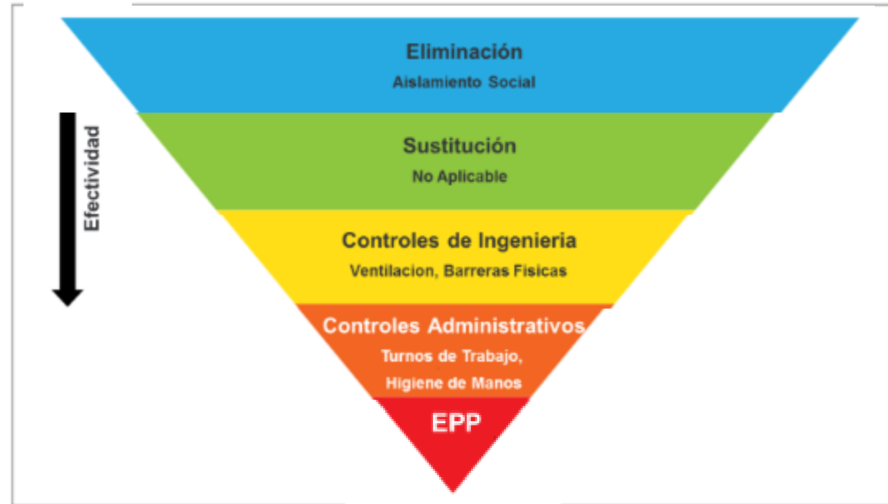
Jerarquía de Controles SARS-CoV-2 Adaptada de NIOSH