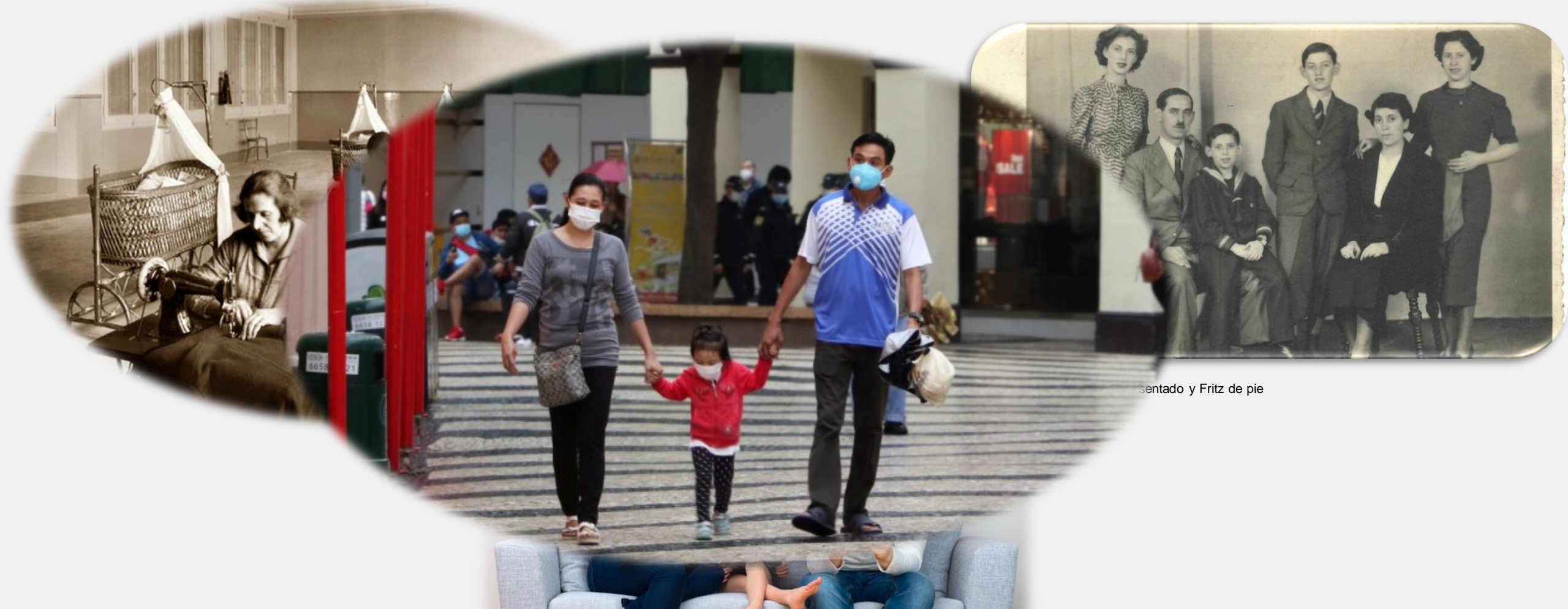
Sentado y Fritz de pie