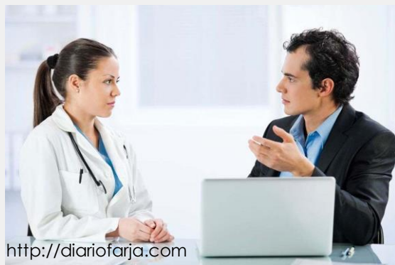
a. Visitador médico

No hay que confundirse, esto no es teletrabajo!