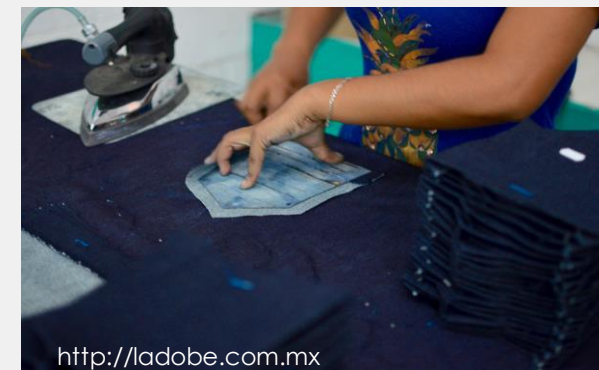
c. Maquila en casa