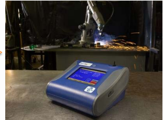
Monitor de Aerosoles DUSTTRAK DRX - contador de partículas

Medición de partículas en tiempo real. Monitoreo continuo de ambientes laborales en tiempo real