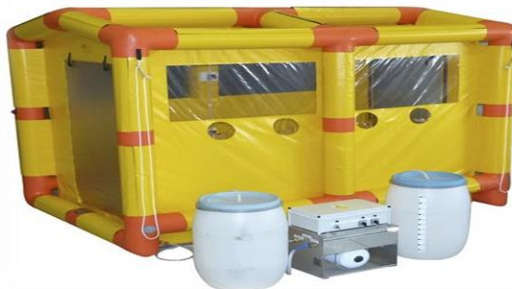
Figura 1. Cabina para retiro de EPP

Área de equipaje: zona designada para dejar el equipaje, desinfectarlo. Solo podrán retirarlo después del proceso de retiro de EPP y desinfección adecuada de manos.