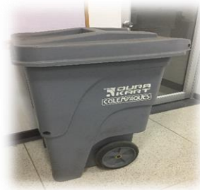
Figura 3. Contenedor en área amarilla