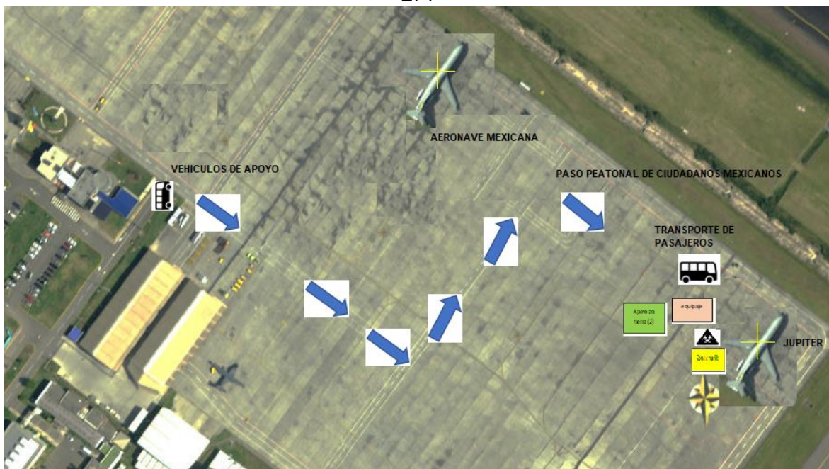
Figura 2. Diagrama de ubicación de la aeronave en tierra, zona amarilla para retiro de EPP